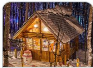
หมู่บ้านนิงเกิลเทอร์เรส