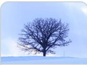
SEVEN STAR TREE