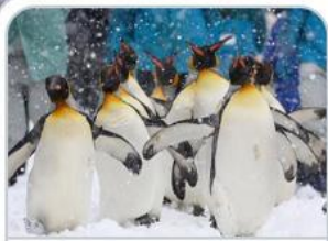
สวนสัตว์อาซากาวะ