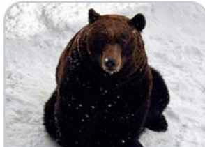
ศูนย์อนุรักษ์ พันธุ์หมีสีน้ำตาล