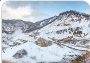
หุบเขานรกจโงคุดานิ