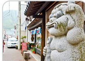
ถนนซัปโปโรโกคุระซุ