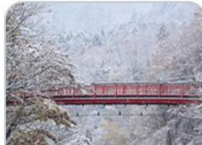
สะพานแขวนฟุตามิ