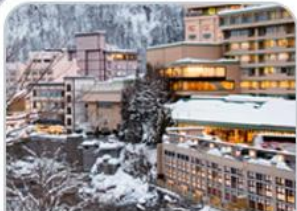
เมืองโจซังเค