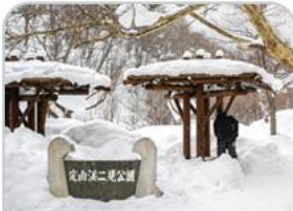
สวนโจซังเค ฟุตามิ