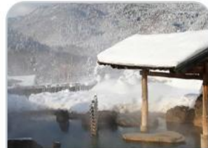
โอบะเคียวออนเซ็น