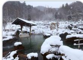
โอบะเคียวออนเซ็น