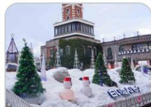
โรงงานช็อคโกแลต