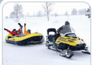
BIBAI SNOW LAND