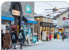
ถนนคนเดิน ซาโงมาจิ